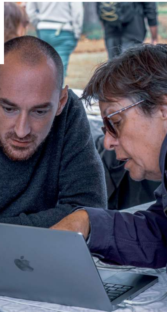
1 ère Restitution des résultats cadastre solaire et thermographie aérienne