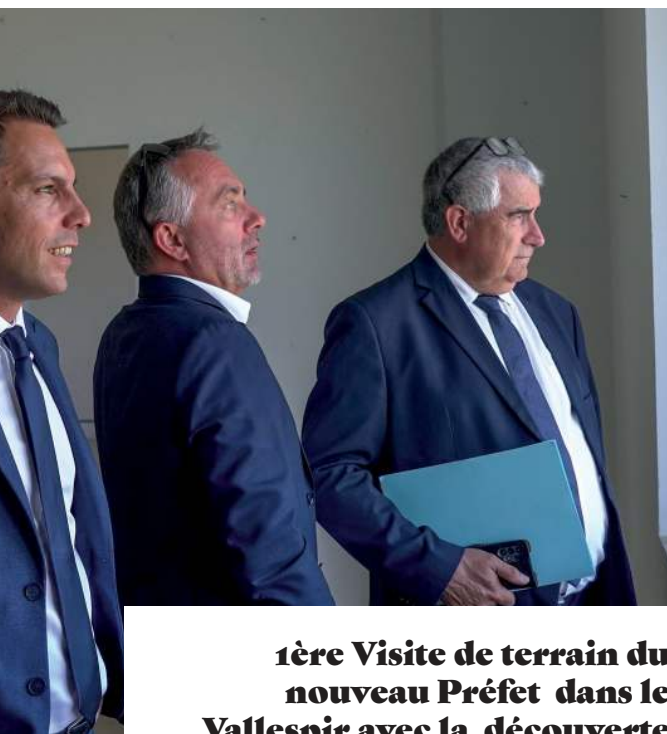
1 ère Visite de terrain du nouveau Préfet dans le Vallespir avec la découverte de la friche industrielle Sainte Marguerite