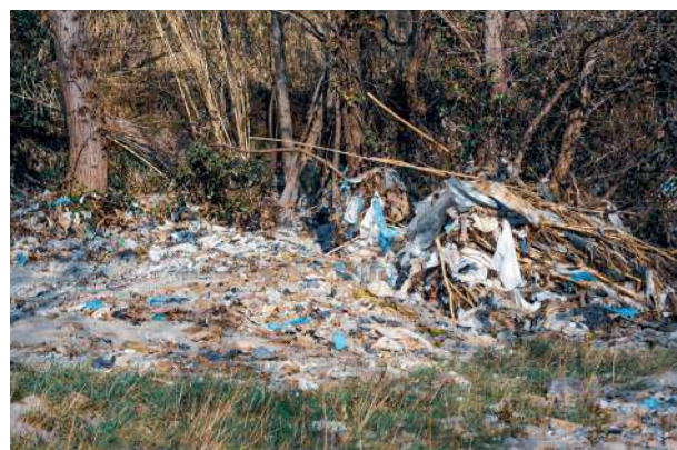
Photo des déchets en surface suite à la crue de janvier 2020. Les déchets furent dispersés sur plus de 2 hectares.

53 sondages ont été réalisés au tracto-pelle, après analyses il est constaté que les déchets sont principalement constitués de sacs plastiques, textiles et verre mélangé avec de la terre.