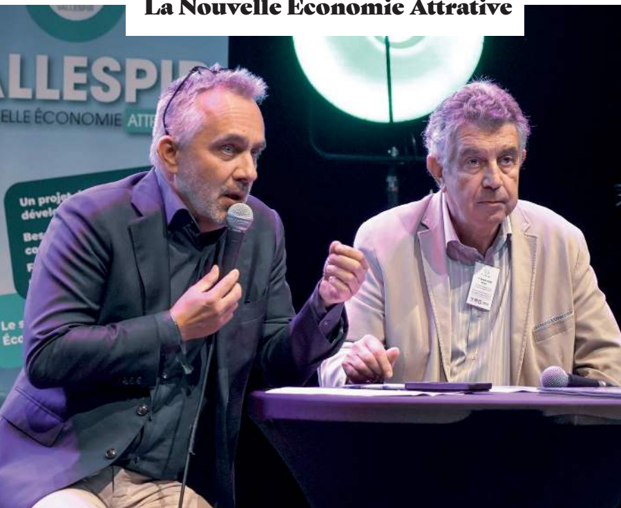
3ème Soirée Inter Entreprises en Vallespir La Nouvelle Économie Attractive