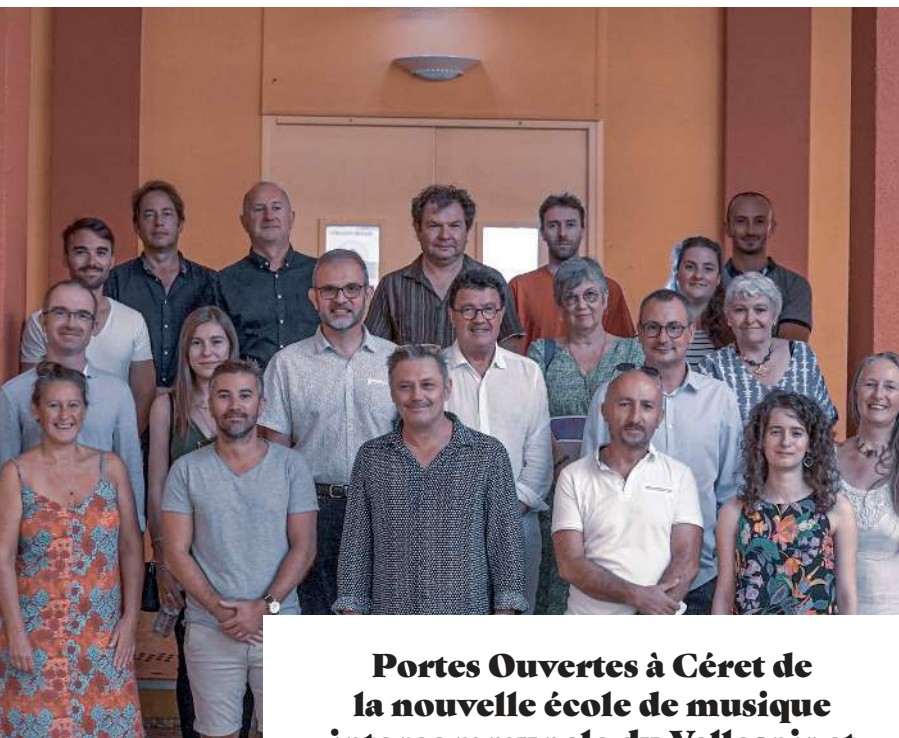
Portes Ouvertes à Céret de la nouvelle école de musique intercommunale du Vallespir et Haut Vallespir