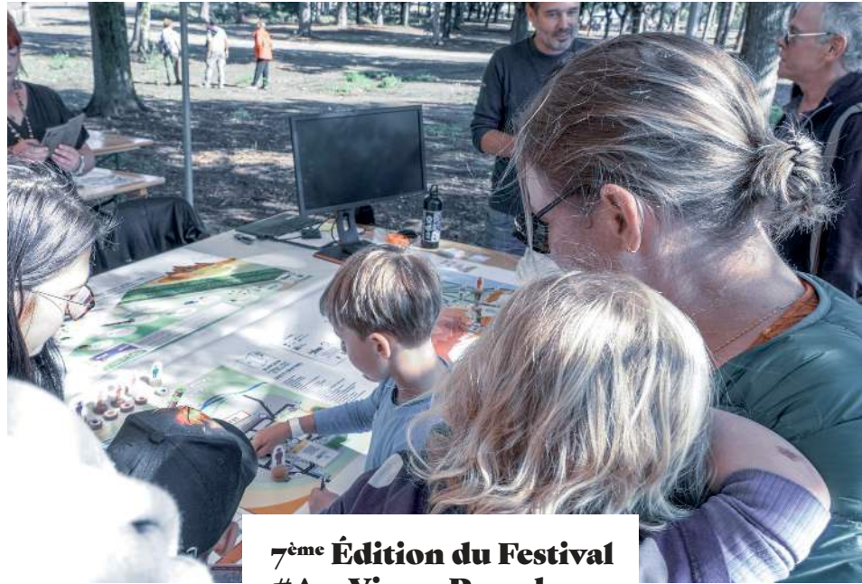
7 ème Édition du Festival #AraVia au Parc du château d'Aubiry